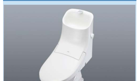
※各写真・イラストはイメージです。見取り図とは異なる場合がありますので、ご注意ください。