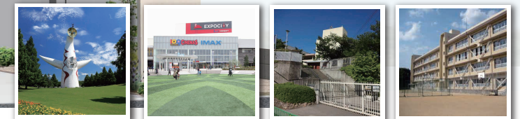
万博記念公園 EXPOCITY 沢池小学校 西陵中学校